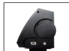
Conexión serial y USB

Distribuidor Autorizado en América Latina: