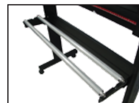
Rodillos ajustables para material