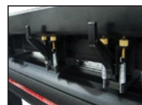
Rodillos de arrastre individuales con rosca para ajustar la presión